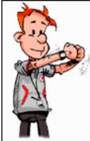
Ceinturer, retenir ou pousser