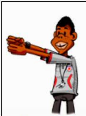
Remise en jeu