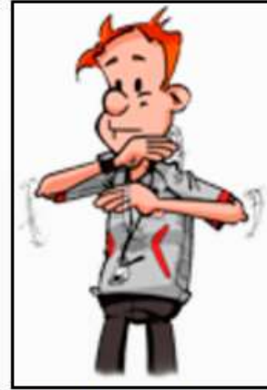
Marcher ou 3 secondes